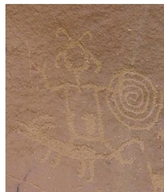
CHACO PETROGLYPH KOLK, MELINDA. CHACOPETROGLYPH1.JPG . 1-OCT. PICS4LEARNING. 7 MAY 2021