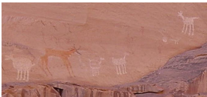
ANTELOPE HOUSE PICTOGRAPH - CANYON DE CHELLY

Como la pictografía, los petroglifos también son imágenes creadas para registrar diferentes tipos de información como historias, creencias y eventos específicos, pero a diferencia de la pictografía que usa pigmentos naturales, los petroglifos se hacen tallando o picando la superficie de una roca. Diferentes tipos de herramientas se usaban para crear estas imágenes y aunque también se han ido borrando con el paso del tiempo, muchas siguen visibles, haciendo posible que los arqueólogos puedan estudiarlas hoy en día. Los arqueólogos también trabajan para preservar la pictografía y los petroglifos y para protegerla del vandalismo.